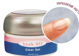
#18941 – 14 мл.