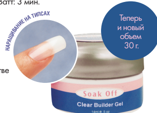
#18942 – 14 мл. #18944 – 30 г.

Прозрачный конструирующий гель Soak Off Clear Builder Gel используется в качестве второй фазы в процедуре укрепления натуральных ногтей и перекрытия тиспов. Время полимеризации в УФ аппаратах 36 Ватт: 3 мин.