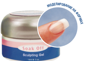
#18943 – 14 мл.