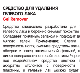
JustGel Gel Remover #19416 — 236 мл. #19417 — 473 мл. TruGel Gel Remover #19316 — 236 мл. #19317 — 473 мл.

Средство специально разработано для удаления гелевого лака и бережно снимает покрытие с ногтя. Обладает приятным запахом и подходит для снятия мягких гелей. Применение: Слегка опилите поверхность ногтя, смочите средством ватный диск и оберните палец алюминиевой фольгой, приложив диск к поверхности ногтевой пластины. Через 10 минут под воздействием средства цветное покрытие аккуратно отслоится с поверхности ногтевой пластины, и гелевый лак можно будет снять с помощью деревянной палочки или пластикового пушера. В зависимости от толщины покрытия вы можете увеличить время или при необходимости повторить процедуру.