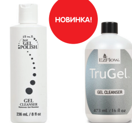
JustGel Gel Cleanser #19414 — 236 мл. #19415 — 473 мл. TruGel Gel Cleanser #19314 — 236 мл. #19315 — 473 мл.

Новое средство для удаления липкого дисперсионного слоя, остающегося после полимеризации гелевых покрытий. Рекомендован для работы с гелевыми лаками — специальная формула способствует сохранению яркого глянцевого блеска верхнего покрытия. Применение: Смочите поролоновый спонж в средстве и аккуратно снимите липкий слой. Для лучших результатов используйте новую сторону спонжа для каждого ногтя.